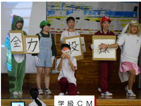
学 級 C M