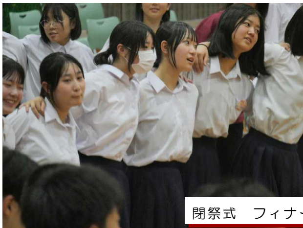
閉祭式 フィナーレ